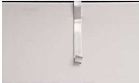
2 CROCHETS par panneau