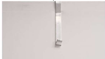
2 CROCHETS par panneau

Sur le panneau en toile rien ne doit être fixé seuls les crochets peuvent servir de fixation. (Voir Annexe pour précision)